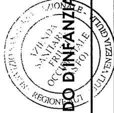
TABELLA DIETETICA PRIMAVERA-ESTATE NIDO D'INFANZIA "MARIA IMMACOLATA" (12-36 MESI)-VINCITA' DI CONCORSO